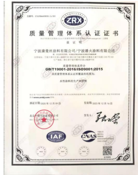
图 2: 管理体系证书图